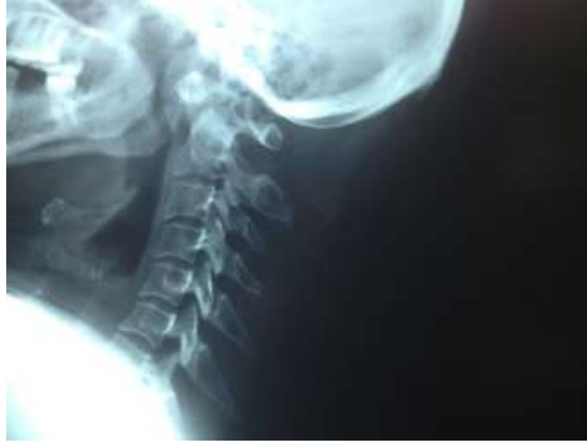
Resim 1. Fleksiyonda lateral servikal grafide dens aksis düzeyinde düzensizlik ve os odontoideuma ait görünüm

50 yaşında kadın hasta yaklaşık bir aydır devam eden her iki üst ekstremitede ağrı ve uyuşma şikayeti ile başvurdu. Hastanın travma veya geçirilmiş ameliyat öyküsü yoktu. Hastanın lateral fleksiyon ve ekstansiyon servikal grafilerinde C1 vertebra anterior arkusunun posterior komşuluğunda, dens aksis ile bağlantısı bulunmayan kemik yapı izlendi (Resim 1,2).