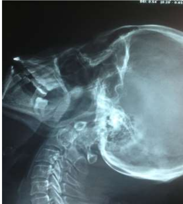
Resim 2. Ekstansiyonda lateral grafi